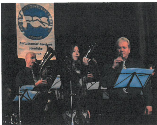
KRAJSKÁ PREHLIADKA MALÝCH DYCHOVÝCH HUDIEB