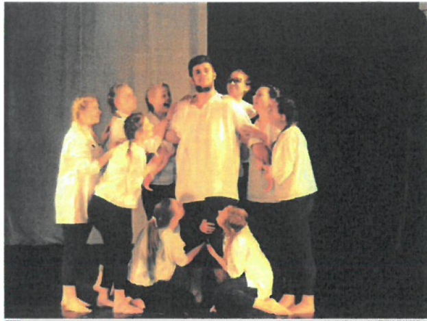
KRAJSKÁ SCÉNICKÁ ŽATVA