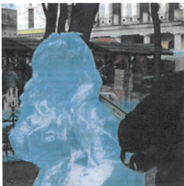
VIANOČNÝ REMESELNÝ TRH