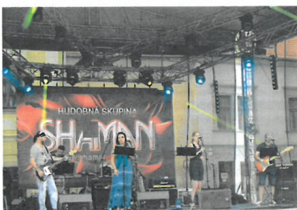
DMP – TAJOMNÁ LEVOČA