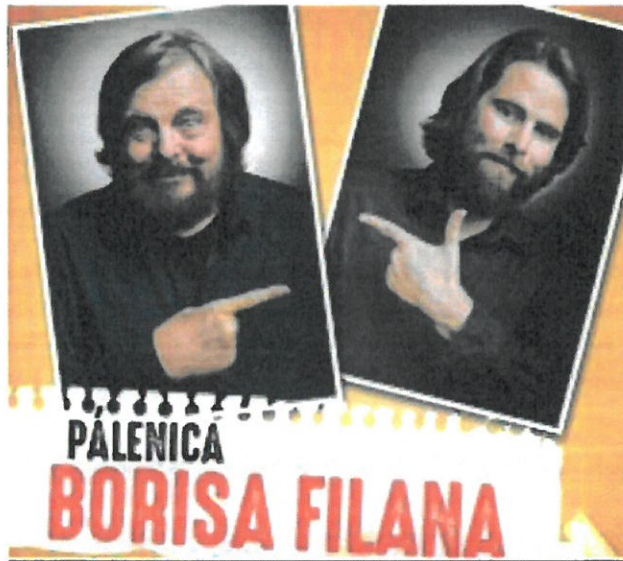
TALKSHOW BORISA A OLIVERA FILANA