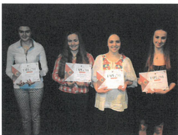
62. ročník HVIEZDOSLAVOV KUBÍN