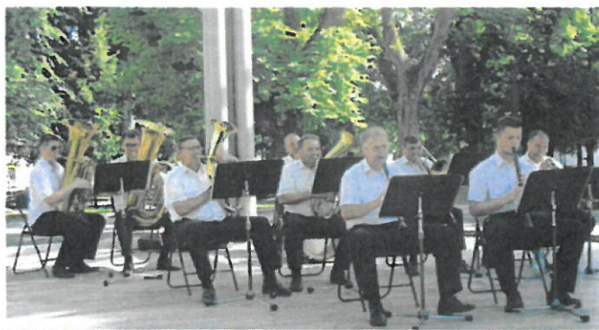
PROMENÁDNE KONCERTY DYCHOVEJ HUDBY MESTA LEVOČA